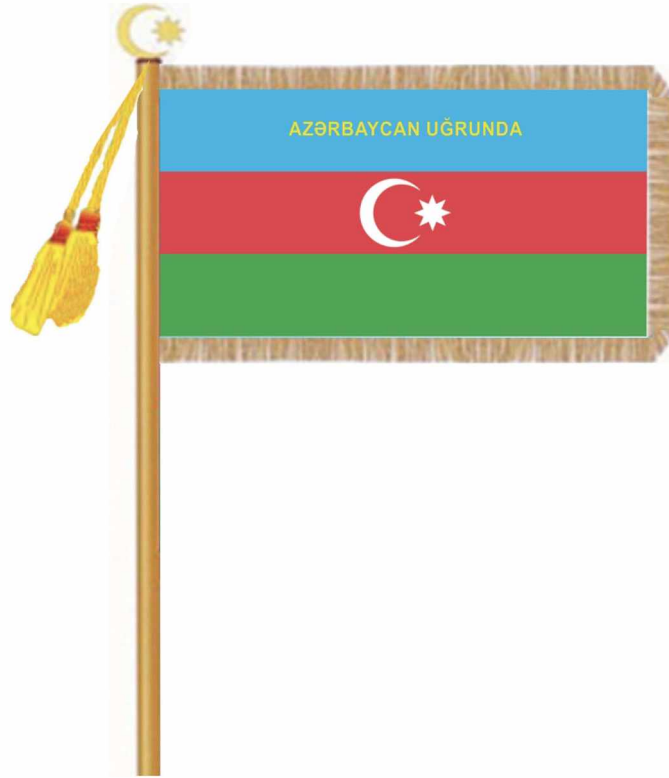
Şəkil 1. Polis Akademiyasının Bayrağının üz tərəfi