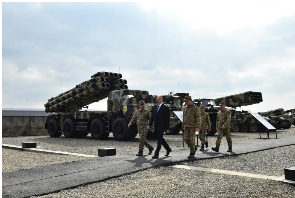
Объем поставок российских вооружений Азербайджану составляет 5 миллиардов долларов.

- В последние годы Азербайджан добился больших успехов в строительстве армии. Вооруженные силы страны сегодня характеризуют крепкая дисциплина, патриотизм, высокий морально-боевой дух и боеспособность. Они оснащены самым современным оружием и военной техникой. Все это, безусловно, привело в последние годы к укреплению военной мощи страны.