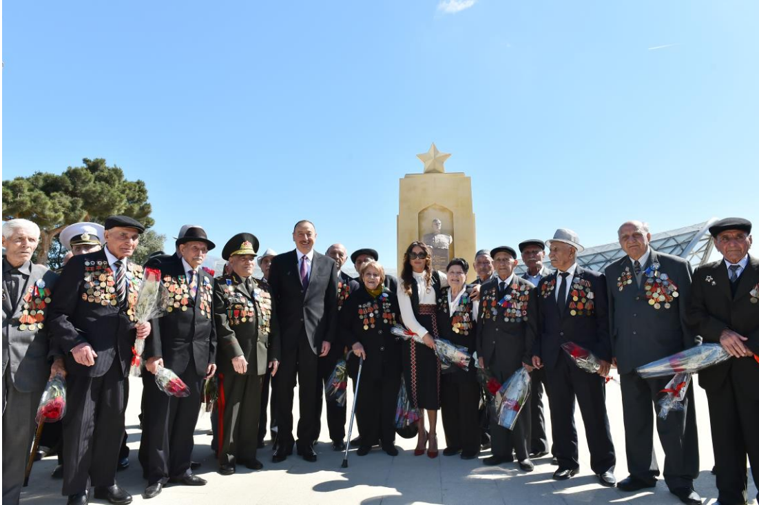
Президент Азербайджана Ильхам Алиев и Первая леди Мехрибан Алиева на встрече с ветеранами Великой Отечественной войны в День Победы.

Азербайджан внес большой вклад в нашу общую Победу. В войне участвовало более 600 тысяч представителей Азербайджана, 300 тысяч из них погибли, более 120 героев Советского Союза – выходцы из Азербайджана, свыше 170 тысяч наших солдат и офицеров награждены различными орденами и медалями.