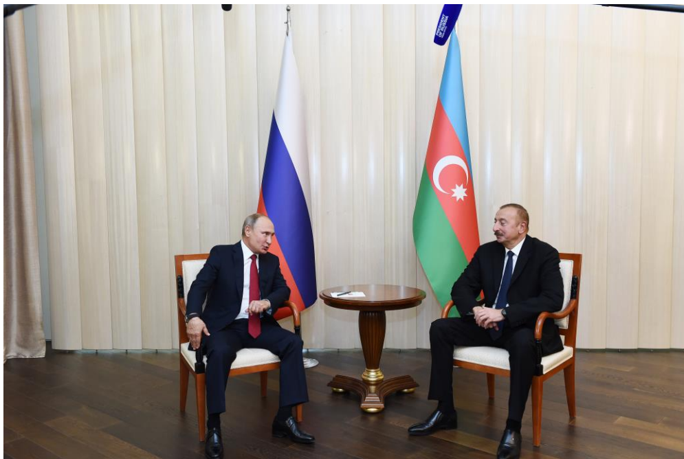
Динамично развивающиеся связи между Россией и Азербайджаном во многом определяются дружеским и доверительным характером взаимоотношений Владимира Путина и Ильхама Алиева.

В прошлом году я по приглашению президента России Владимира Путина принял участие в заседании дискуссионного клуба «Валдай». Я был одним из четырех глав государств, получивших приглашение на это мероприятие, которое каждый год приковывает к себе внимание политиков, политологов, экспертов и аналитиков во всем мире. Валдайский клуб зарекомендовал себя как одна из важнейших дискуссионных платформ для обсуждения ключевых проблем мировой повестки дня.