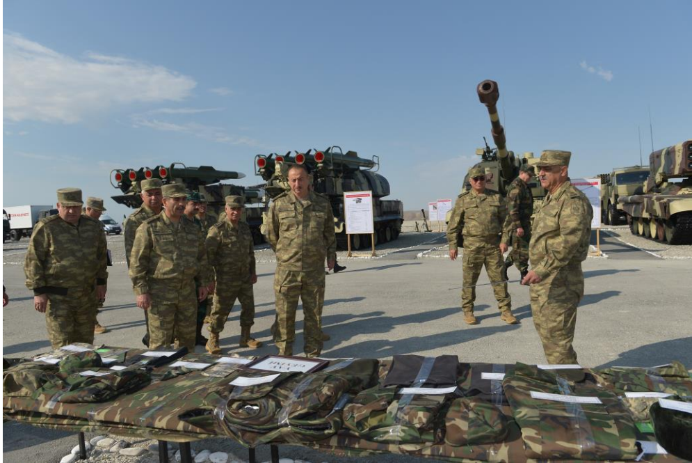
Ильхам Алиев знакомится с современными образцами вооружений азербайджанской армии и перспективной экипировкой военнослужащих.

Позднее, в 1918 году, когда была создана Азербайджанская Демократическая Республика, одним из первых ее указов был указ о передаче Еревана из состава Азербайджана в состав Армении и объявлении его столицей Армении. Это тоже исторический факт. В 1921 году Кавказское бюро большевистской партии приняло решение о сохранении Нагорного Карабаха в составе Азербайджана. О сохранении, а не передаче, как пишут некоторые армянские историки. Это – тоже исторический факт. Еще один исторический факт заключается в том, что в 1923 году Азербайджанская Советская Социалистическая Республика приняла указ о создании Нагорно-Карабахской автономной области в составе Азербайджана.