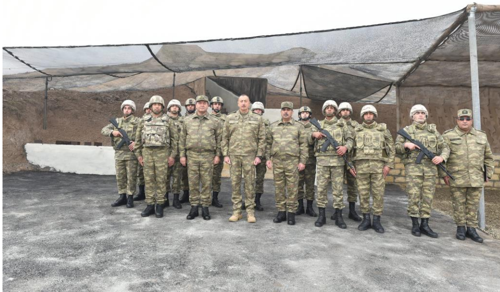
Президент Азербайджана, Верховный главнокомандующий Вооруженными Силами Ильхам Алиев в ходе посещения командного пункта на территориях, освобожденных от армянской оккупации в 2016 г., ознакомился с оперативной обстановкой.

сотрудничества, Европейский парламент и другие, и то, что ни одна страна не признала незаконное образование, так называемую Нагорно-Карабахскую республику, то видим, что решение конфликта должно быть в плоскости признания территориальной целостности Азербайджана и уважения его суверенитета. Армянские войска должны быть немедленно и безоговорочно выведены с оккупированных территорий, а беженцы и вынужденные переселенцы, изгнанные из этих земель, должны быть возвращены на свои исторические места проживания.