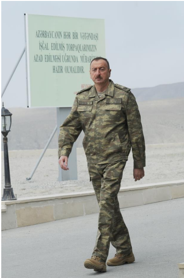
Укрепление азербайджанской армии, повышение ее боевой мощи и технической оснащенности – один из важнейших приоритетов в деятельности Президента Азербайджана, Верховного главнокомандующего Вооруженными Силами Ильхама Алиева.