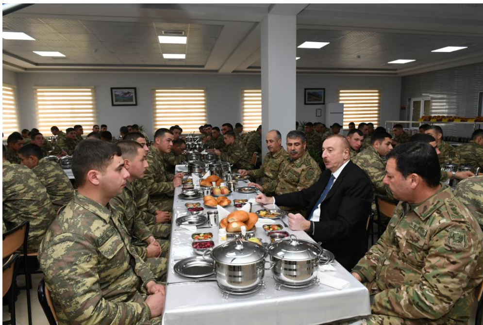
Президент Азербайджана, Верховный главнокомандующий Вооруженными Силами Ильхам Алиев знакомится с условиями службы и быта в воинской части в Бейляганском районе.

В последние годы приобретены самая современная техника и оружие. Среди них - сотни единиц бронетехники, многочисленные сторожевые, военные корабли, системы противовоздушной обороны, десятки боевых самолетов, более сотни боевых, военно-транспортных и транспортных вертолетов, самые современные разведывательные и боевые беспилотные летательные аппараты, средства ПВО, противоракетной обороны, самые современные средства связи, реактивные системы залпового огня, оперативно-тактические ракетные комплексы.